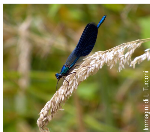
Immagini di L. Turconi